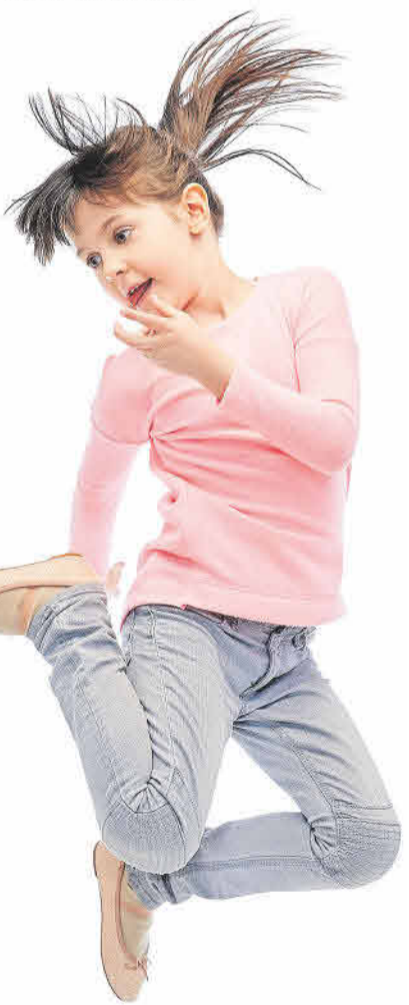
erlebnispädagogische und sexualpädagogische Projekte bietet das Gesundheitsamt für Schulklassen an.

In der Schulzeit bietet das Gesundheitsamt zahnärztliche Untersuchungen und Beratung an. In verschiedenen Schulen finden zudem regelmäßig Suchtpräventionstage statt, die in Zusammenarbeit mit dem kommunalen Suchtpräventionsbeauftragten aus dem Gesundheitsamt organisiert werden. Auch